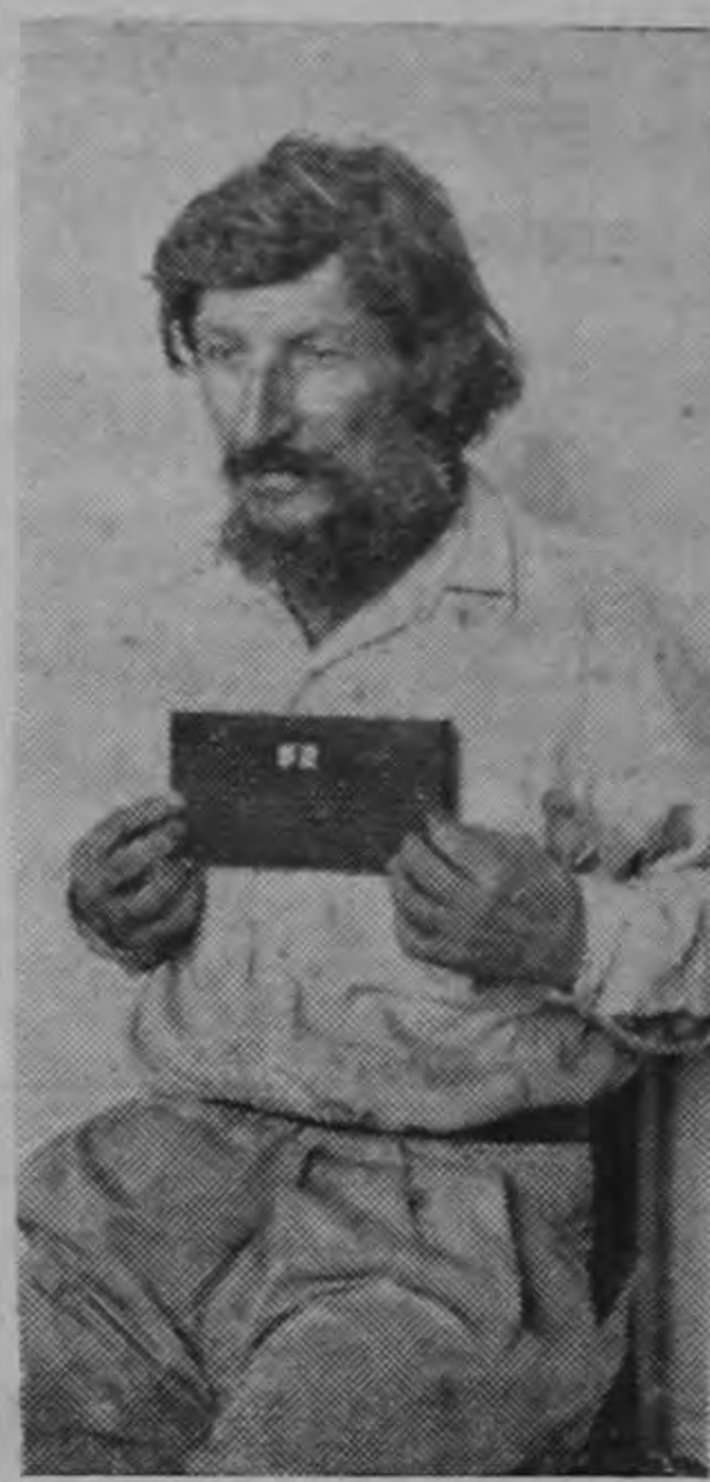
Frente al fotógrafo de Previsión Social, este mendigo sostiene el pizarrín con el número 52, indicador de que, hasta ese momento, han pasado del medio centenar los inscritos en el registro de pordioseros.