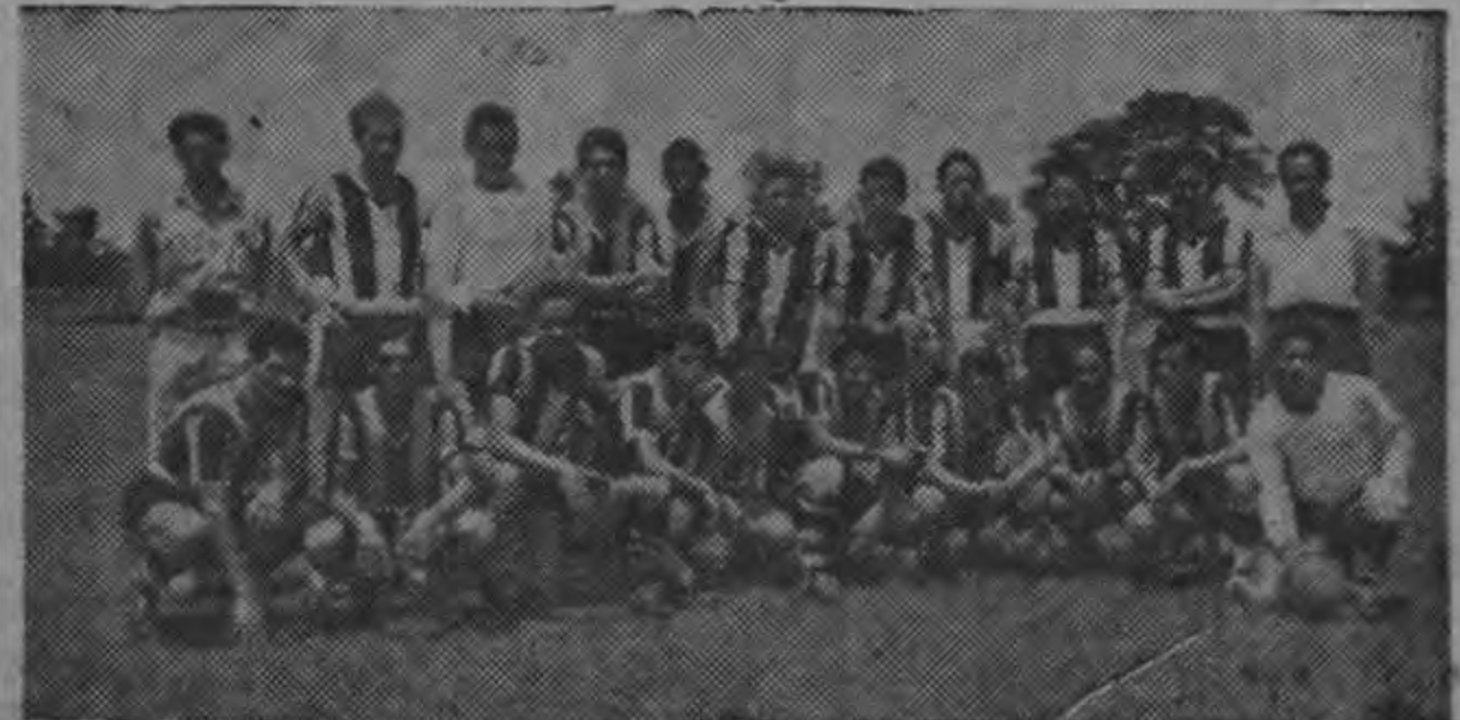
Conjunto del Club Sport Uruguay que esta noche tiene un serio compromiso frente al Club Sport La Libertad.

WASHINGTON 6 (INS) —El gobierno norteamericano expidió órdenes de expulsión contra el editor de un periódico que se publica en Nueva York en el idioma ruso fundándose en que el interesado es un extranjero que se trata de Boris Sklar editor de "Medica" a actividades comunistas. Russky Golos.