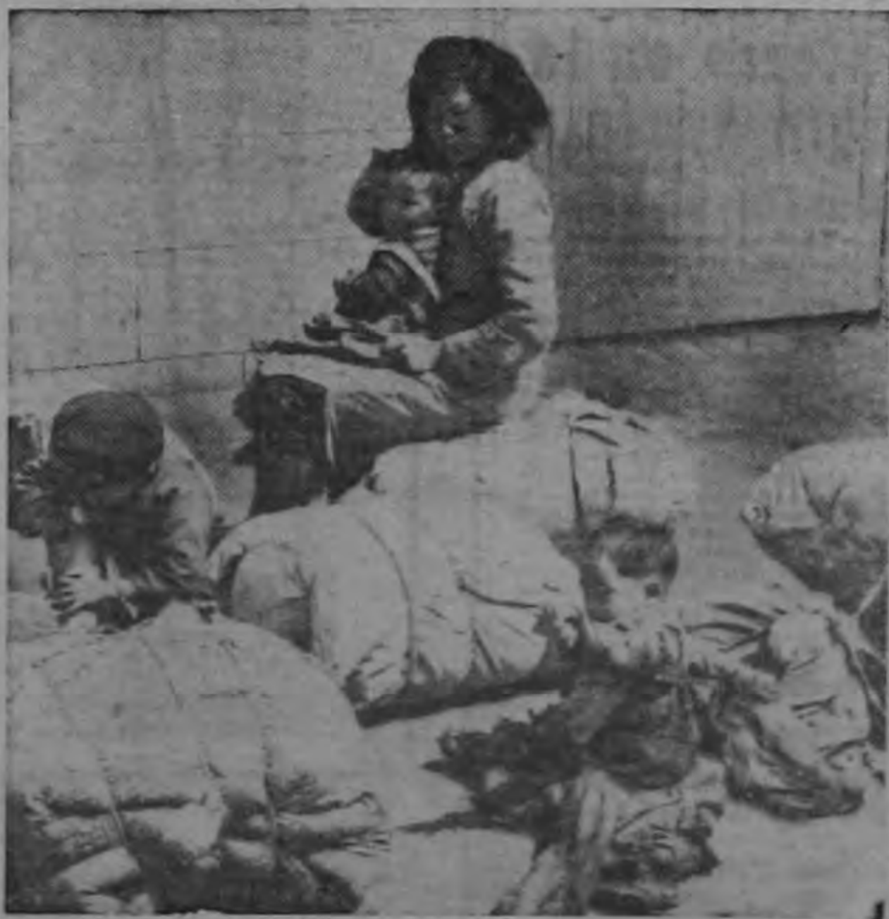
Una madre china, refugiada, y sus tres hijos, que lograron escapar del Régimen de los Rojos. Se ha comprobado que la leche en polvo soviética destinada a niños como éstos, es de infima calidad, a pesar de la extravagante propaganda que le hacen los comunistas.

mayor que el de un profesor universitario Chino que trabaje en el mismo departamento. Según desechos privados pero de fuentes fidedignas, esta discriminación en nada fomenta la amistad genuina Chino Ruso, ni tampoco ayuda al desarrollo de la mutua cooperación especialmente si se toma en cuenta que en muchas ocasiones los Rusos son menos competentes y