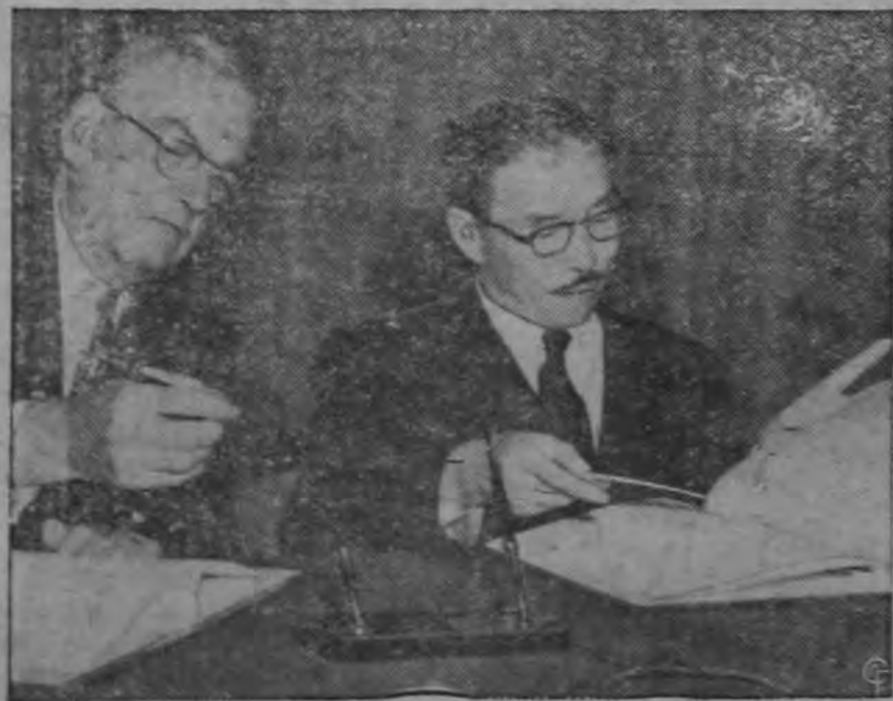
LOS EE. UU. FIRMAN PACTO CON SUDCOREA.—El Secretario de Estado John Foster Dulles, y el Dr. Y. T. Pyun, Ministro del Exterior de la República de Corea, firman un pacto de defensa mutua en una ceremonia oficial en Washington. Dulles dijo que el pacto representa "otro eslabón en la seguridad colectiva de las naciones libres del Pacífico".