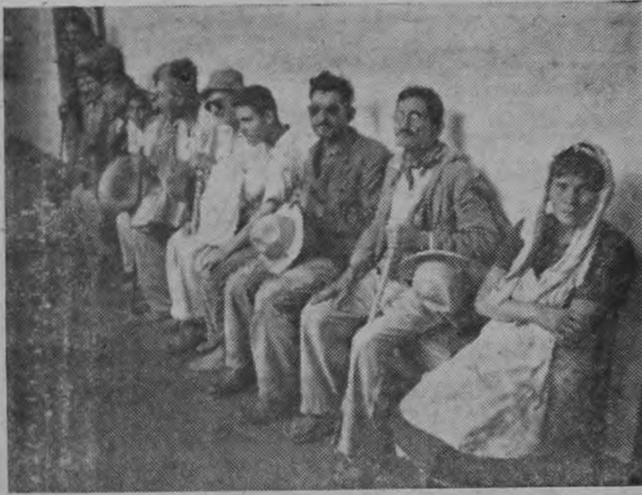
Varios pordioseros haciendo espera en las antecámaras de Previsión Social, listos para el interrogatorio e investigación a que van a ser sometidos.