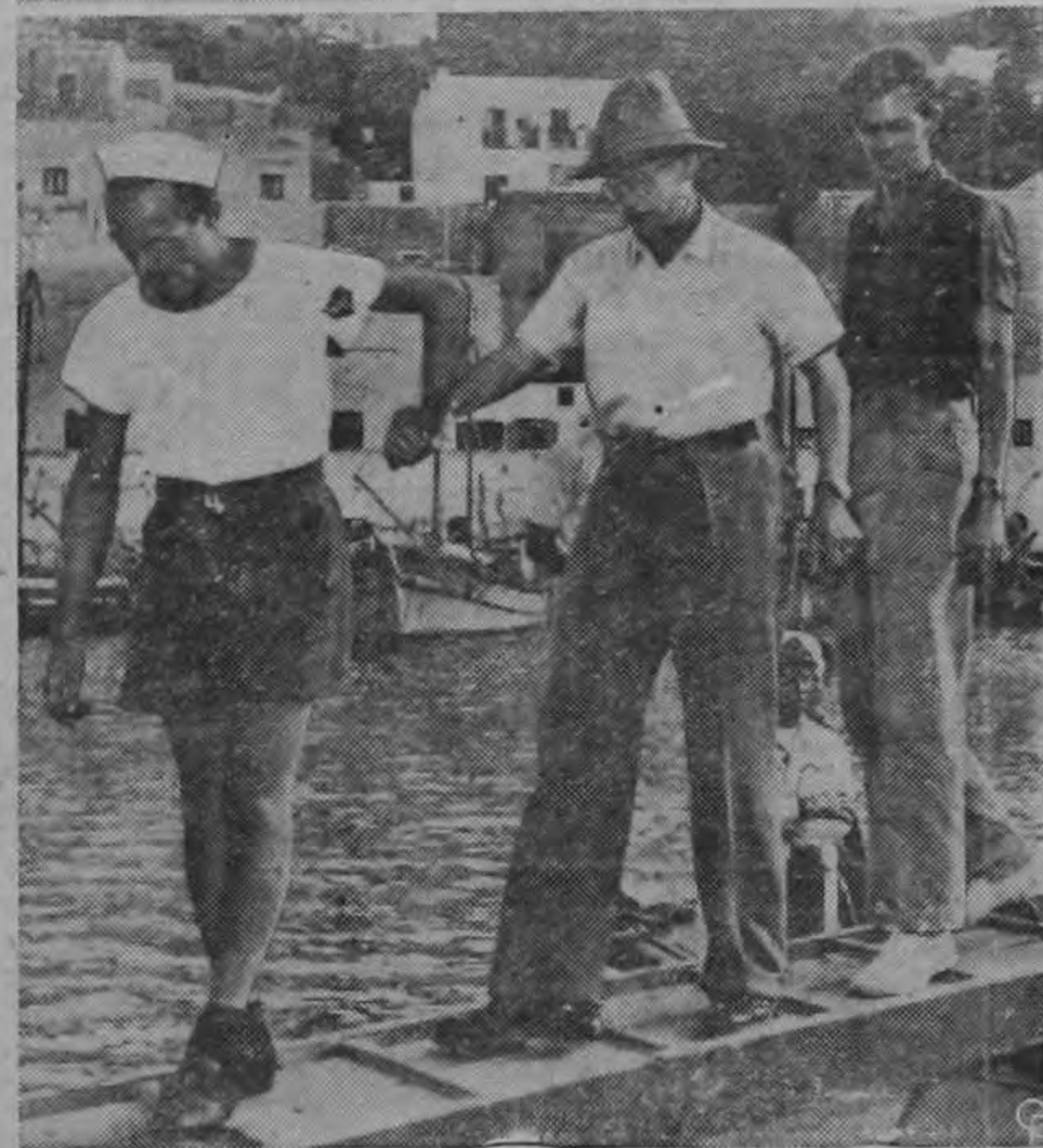
EL PROFESOR PICCARD ESTABLECE UN RECORD DE PROFUNDIDAD.—El profesor August Piccard, de 69 años, desembarca en la isla de Ponza, Italia, seguido por su hijo Jacques (derecha) de 31 años, después que descendieron a unos 3.200 metros en el Mediterráneo, la mayor profundidad alcanzada por el hombre. Hicieron el descenso en el "Bathyscaphe" "Trieste" diseñado por Piccard. Ese hombre de ciencia nacido en Suiza que se hizo famoso por sus ascensiones en globo a la estratosfera junto con su hermano gemelo, dijo que solo habían encontrado una obscuridad impenetrable "que ni aun nuestro poderoso reflector conseguía romper".