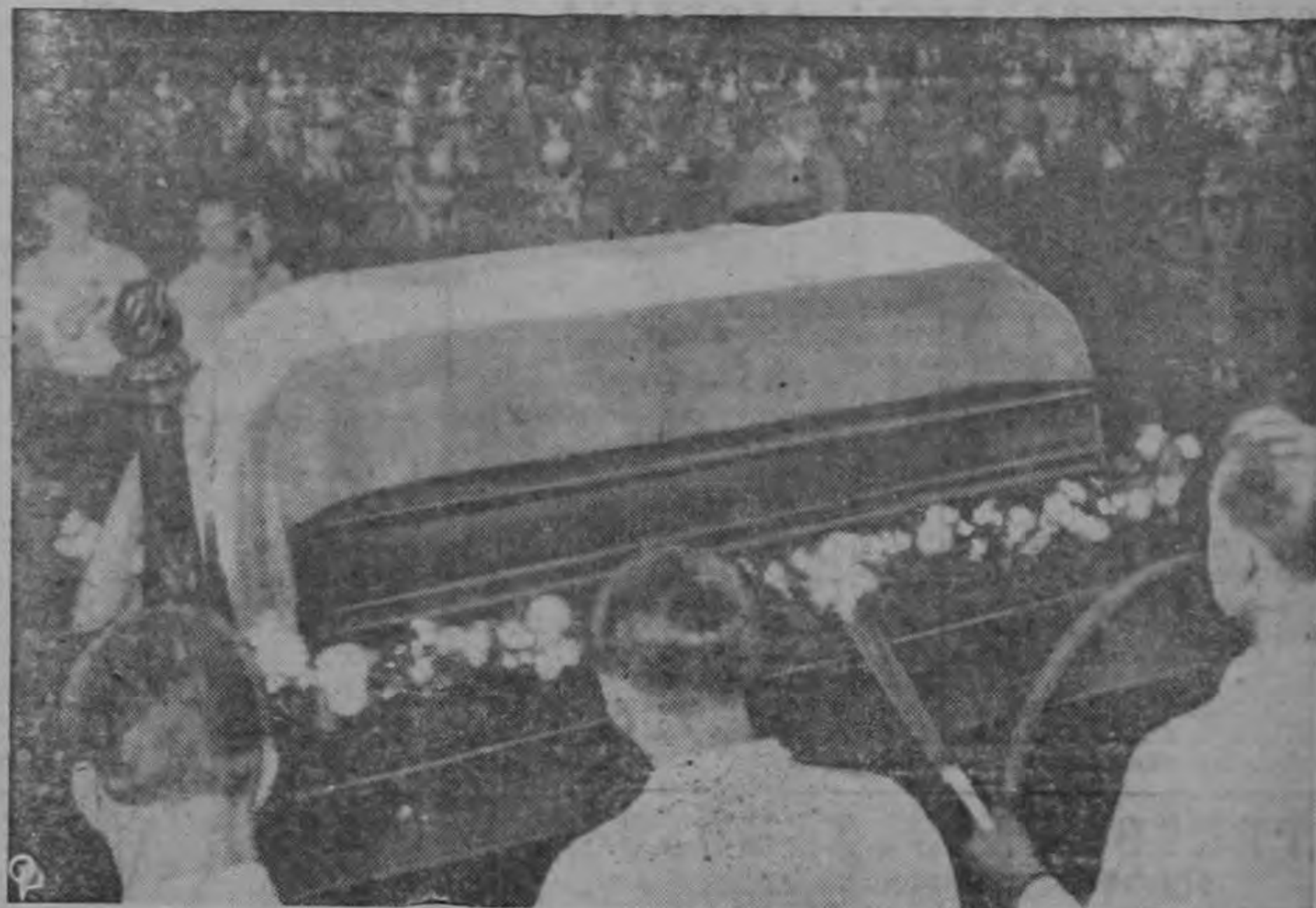
EL ULTIMO VIAJE DE REUTER AL AYUNTAMIENTO DE BERLIN.—Cubierto por una bandera aparece el ataúd que contiene los restos del Dr. Ernest Reuter, Alcalde del Berlin Occidental, en los momentos de ser sacado de su casa en el suburbio de Zehlendorf, para ser llevado al Ayuntamiento donde se le hicieron funerales de Estado. Reuter, un decidido anti-comunista, falleció de un ataque al corazón. (INP)

Otra empresa de Dunstable produce asimismo cascos de extraordinaria resistencia, hechos con un material de fenol y amianto. Los cascos pesan solamente de 280 a 320 gramos.