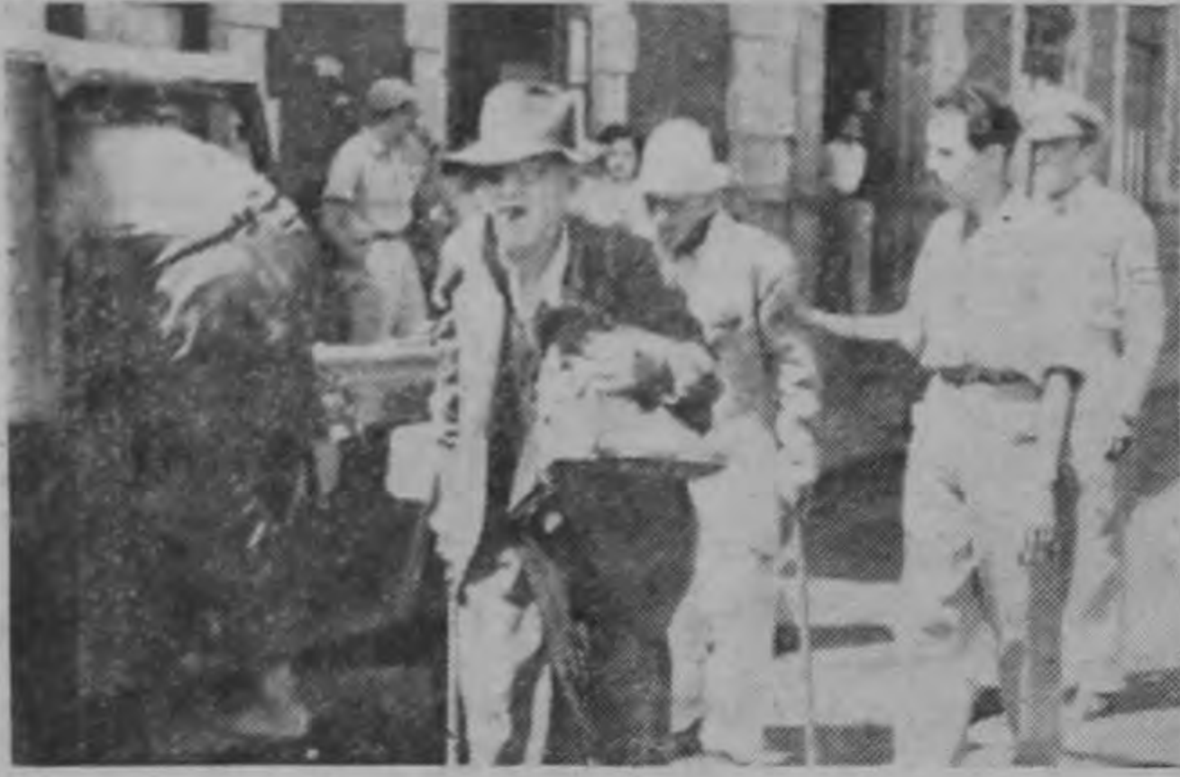
Las autoridades comenzaron ayer a recoger a los mendigos de la ciudad. Aquí vemos un jeep pronto a conducirlos a las oficinas de Previsión Social.