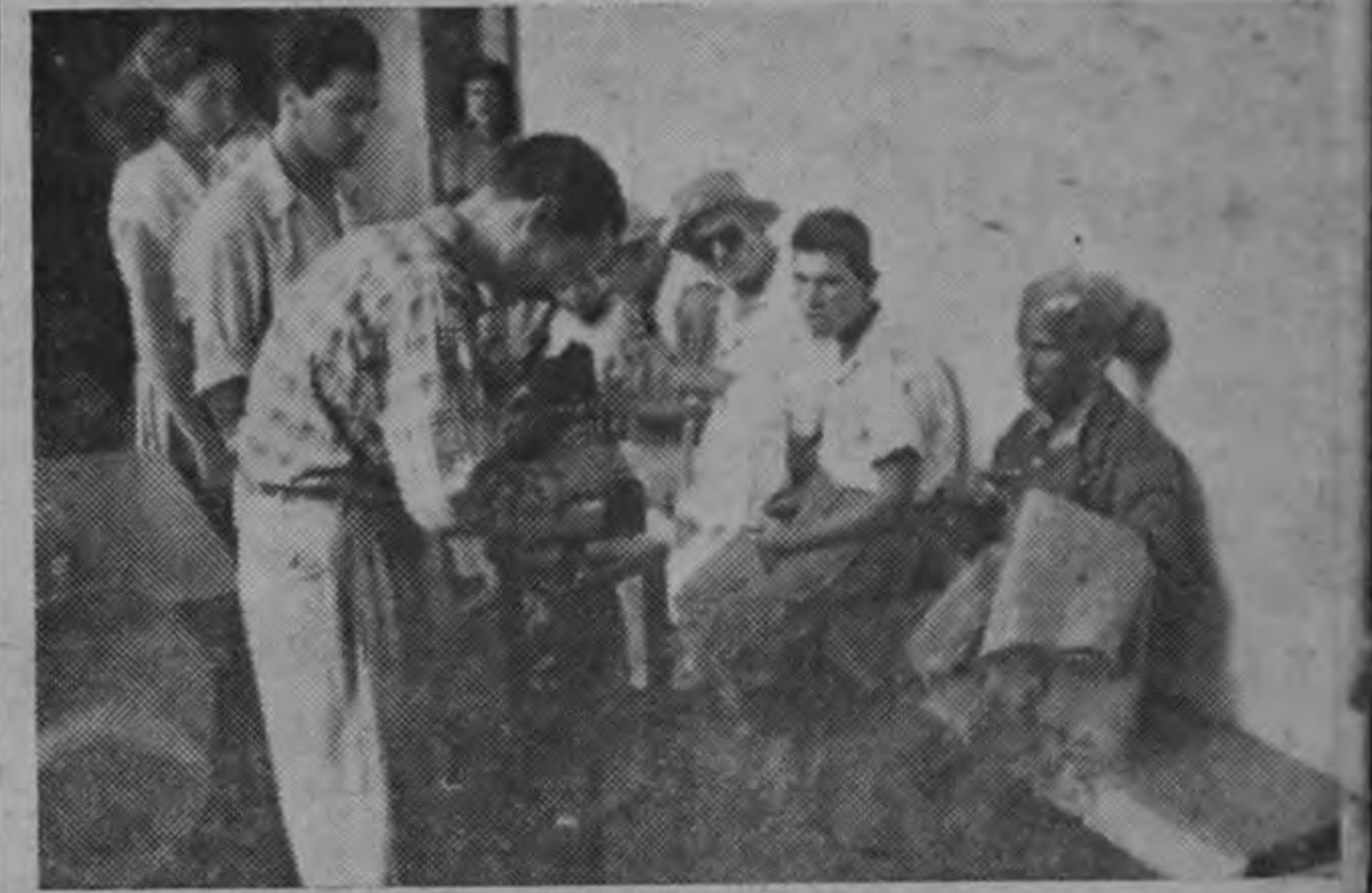
Empleados de Previsión Social toman fotografías para el registro de menesterosos.