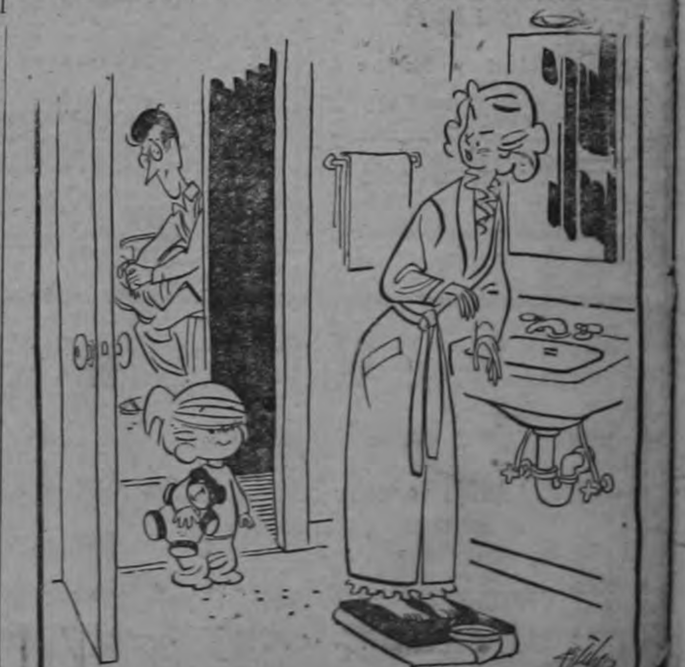
¿Qué dices de que ya no estoy en edad de presumir? ¿Te lo dijo tu padre?