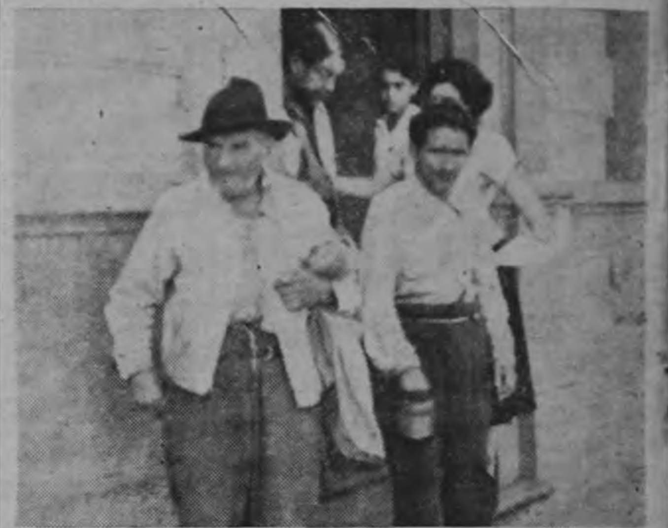
Después de haber sido interrogados y registrados en el Ministerio de Trabajo, los mendigos abandonan el local.